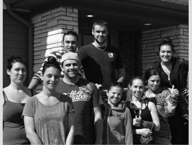
L'équipe d'Industrielle Alliance après une journée bien remplie!

Comme les années passées, nous avons pu compter sur des parents membres qui viennent effectuer des tâches de bénévolat. Que ce soit pour l'entretien de la cour, les corvées ou le potager, c'est un soutien incroyable pour tous. Merci à toute l'équipe qui s'occupe de la tonte du gazon!