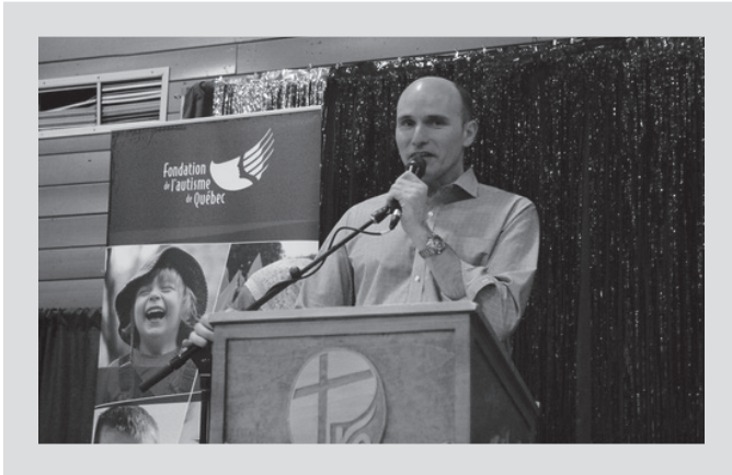
Le ministre de la Famille, des Enfants et du Développement social, et député de Québec, M. Jean-Yves Duclos, s'est adressé aux convives présentes

Souignons aussi la présence de M. Jean-Yves Duclos, ministre de la Famille, des Enfants et du Développement social, et député de Québec, accompagné de son épouse, ainsi que celle de M. Joël Lightbound, député de Louis-Hébert.