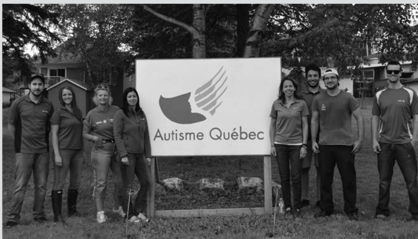
L'équipe de BMO a offert un solide coup de main

Merci à tous et à toutes! Votre apport est inestimable : vous contribuez à la bonne marche de nos activités et au mieux-être de nos familles!