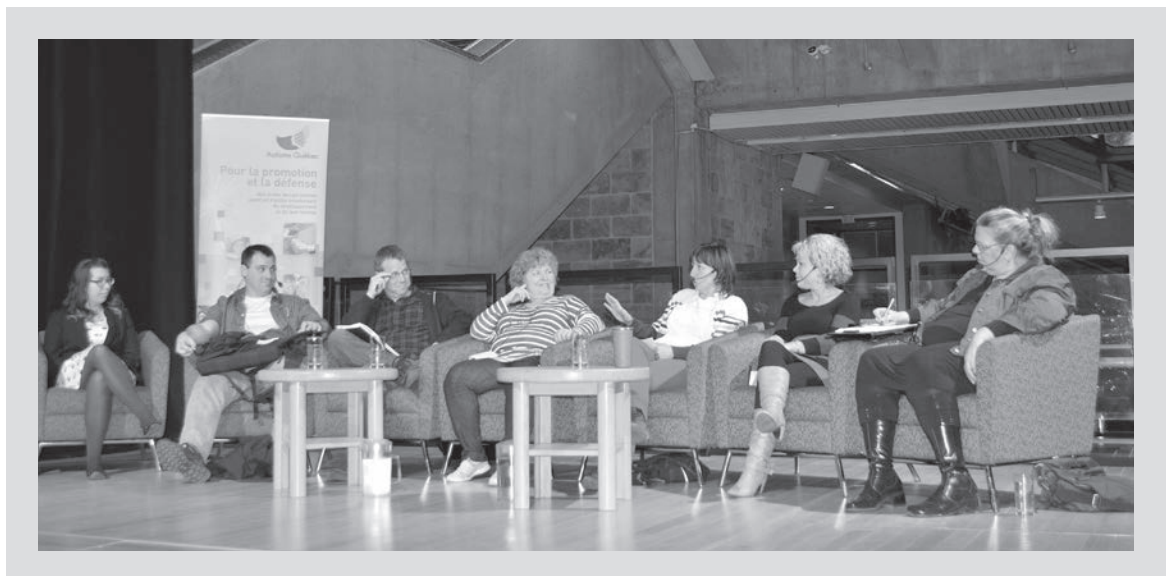
Table ronde au Musée de la Civilisation : Les personnes autistes et les relations amoureuses.