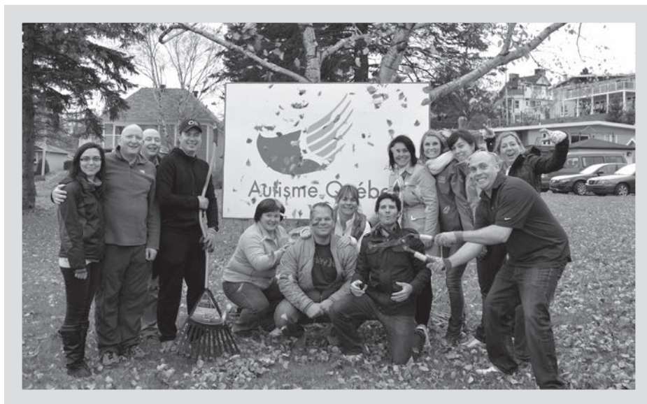
L'équipe de Xerox Canada ayant participé à une des corvées d'automne.

Merci à tous et à toutes! Votre apport est inestimable: vous contribuez à la bonne marche de nos activités et au mieux-être de nos familles!