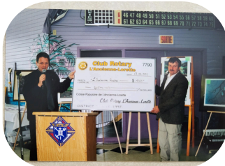
Club Rotary L'Ancienne-Lorette, un fidèle partenaire