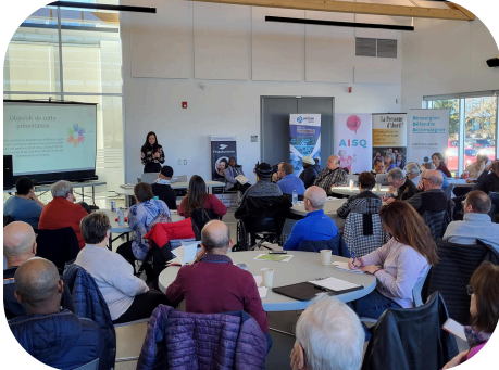
Formation sur Programme de revenu de base, REEI, Curateur public en collaboration avec Finautonome 2023