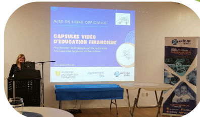
Lancement des capsules d'éducation financière, une collaboration avec l'Autorité des marchés financiers (AMF), 2022