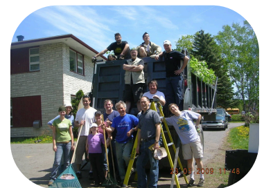
Corvée de bénévoles 2009