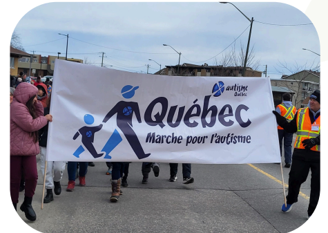
Québec marche pour l'autisme 2025