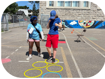
Olympiades - camp L'Escapade 2025