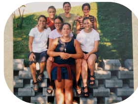
Quelques défis sportifs : grimper le Mont Blanc et parcourir le continent américain à vélo