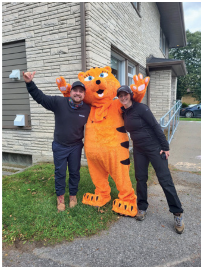
Chat prise est venu encourager les bénévoles de Deloitte.