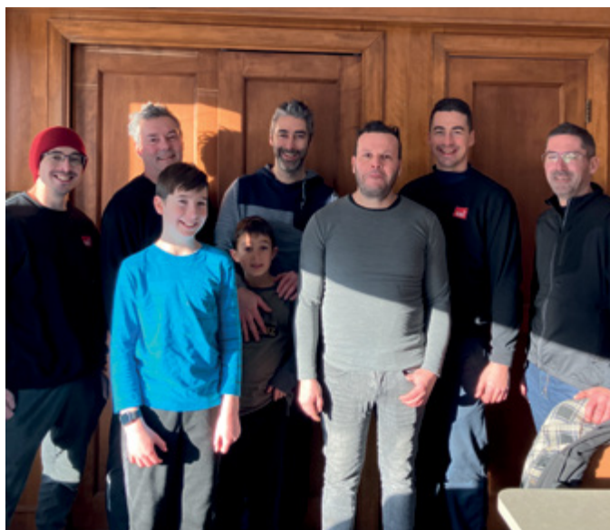
Chez SBI, l'implication bénévole est une histoire de famille.