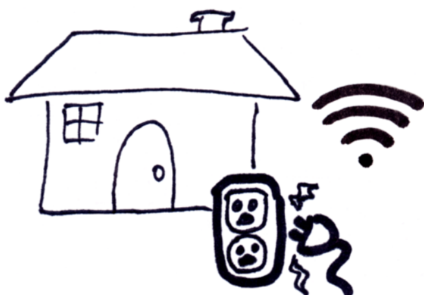
Des exemples de dépenses fixes