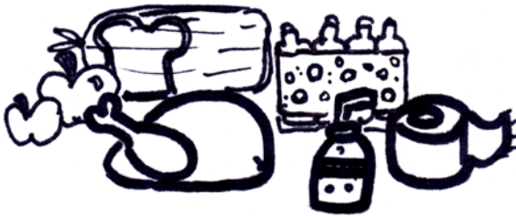
Des exemples de dépenses variables